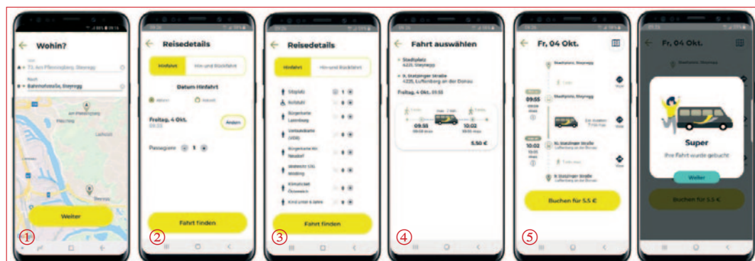
1. Start/Ziel eingeben → 2. Abfahrtszeit eingeben → 3. Personen & Sitzplätze → 4. Fahrt wählen → 5. Buchen.

Buchen Sie Ihre Fahrt über das Callcenter: 0800 80 80 66 .